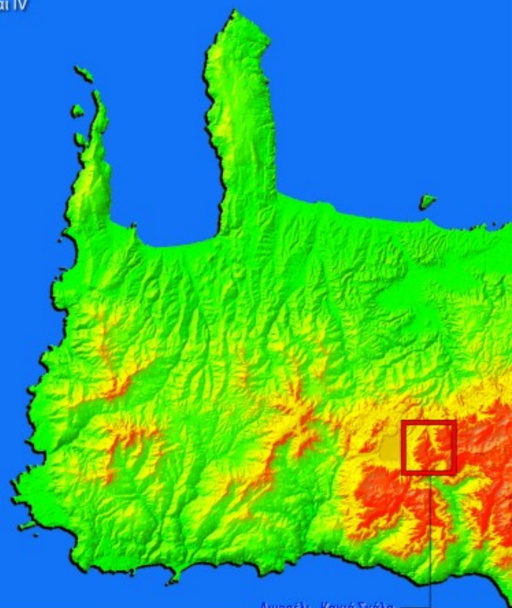
Λινσοέλι - Κακιά Σκάλα