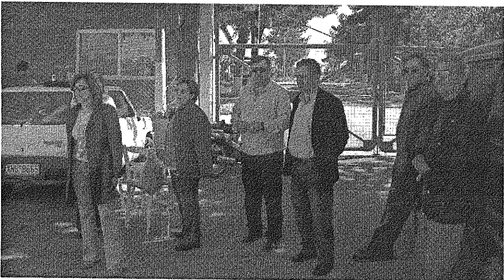
Απέκλεισαν και πάλι την είσοδο, διεκδικώντας το δικαίωμα στην εργασία.