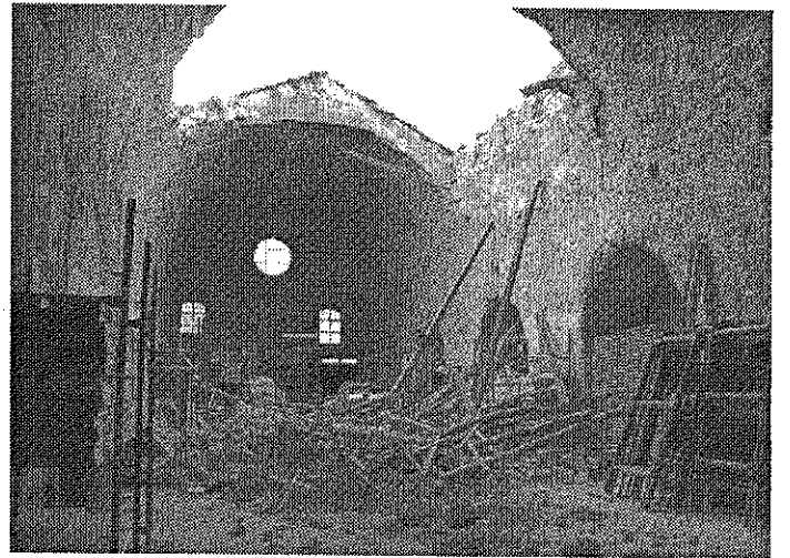
Σεισμόπληκτος ονομάστηκε ο Νομός Χανίων.

Β. Για τους υπόλοιπους Δήμους και Κοινότητες του Νομού Χανίων οι δικαιούχοι στεγαστικής συνδρομής θα καθορίζονται ονομαστικά με Αποφάσεις του Υπουργού ΠΕ.ΧΩ.Δ.Ε. σύμφωνα με τα πορίσματα των αρμοδίων επιτροπών του Υ.ΠΕ.ΧΩ.Δ.Ε. Οι αποφάσεις αυτές θα δημοσιεύονται στην