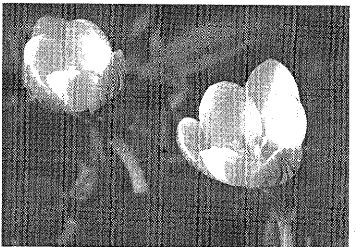
Δίκτυο μικρο-αποθεμάτων φυτών.

Τα θέματα που θα συζητηθούν τα μέλη της επιτροπής, είναι τα α-